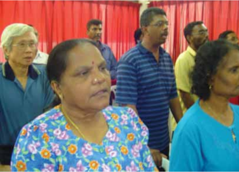
குண்டாங்கில் பங்குப் பயிற்சி