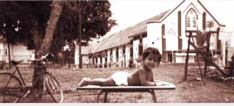
செந்துல் மேம்பாடு அடைவதற்குமுன்

மக்களுக்கு, புடுவில் (புனித அந்தோணியார் ஆலயம்), சீனம் பேசும் மக்களுக்கு பிரிக்பீல்ட்சில் (செபமாலை ஆலயம்) என இரு தேவாலயங்கள் கட்டப்பட்டன. இரயில் போக்குவரத்துத் துறையில் அதிக தமிழ் பேசும் மக்கள் இருந்ததால், தமிழ் பேசும் மக்கள் எண்ணிக்கையும் அதிகரித்த வேளையில், செந்துல் பகுதியிலிருந்து புனித அருளப்பர் ஆலயம் செல்ல தூரமாக இருந்தபடியால், புனித அன்னம்மாள் பெயரில் ஒரு சிற்றாலயம் எழுப்பப்பட்டது. பின்னர் தொழிலாளர்கள் அதிகம் இருந்தபடியால் 15 நவம்பர் 1908இல் அது புனித சூசையப்பர் சிற்றாலயமாக பெயர் மாற்றம் செய்யப்பட்டது.