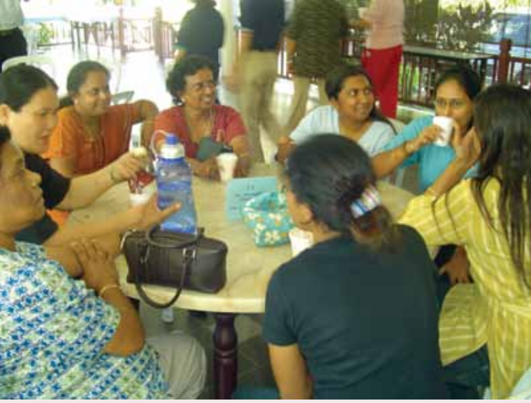
குண்டாங்கில் பங்குப் பயிற்சி

ஒவ்வொரு ஜூபிலி ஆண்டும் இறைவனின் தயவை வெளிப்படுத்தும் ஆண்டு. இறைவன் அளிக்கும் விடுதலையை அனுபவிக்கும் ஆண்டாக உள்ளதால் (லேவி 25:8-55), அவரில் அக்களிக்கும் பாக்கியத்தை நாம் பெறுகிறோம். நமது முன்னோர்களின் விசுவாசமும் நம்பிக்கையும் இப்பங்கை உருவாக்கியதைப்போல், இன்றுள்ள நாம் அவர்கள் காட்டிய விசுவாச ஒளியில், 'ஒன்றுபட்ட அக்கறைக்காட்டும் சமூகம் என்னும் தூர நோக்குச் சிந்தனையில், இப்பங்கு வரலாற்றில் பங்குபெற வாய்ப்பைப் பெற்ற மக்களாக, நன்றியுணர்வுடன் பயணத்தைத் தொடர்வோம். அடுத்தத் தலைமுறையினரிடம் ஒப்படைக்கும் வரை அன்பு பணிபுரிய வேற்றுமை களைந்து, ஓர் உடல் மக்களாக மிளிர்வோம்.