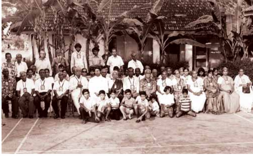
பங்கு மக்கள் பங்கு இல்லத்தின் பின்னால்