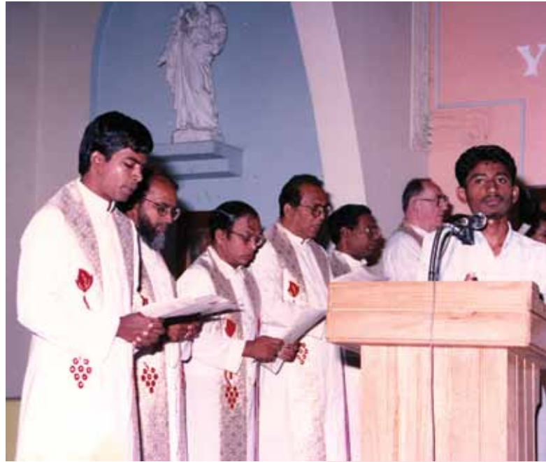
அருட்திரு பெனடிக்ட், அருட்திரு சூசை, அருட்திரு ஜேம்ஸ்